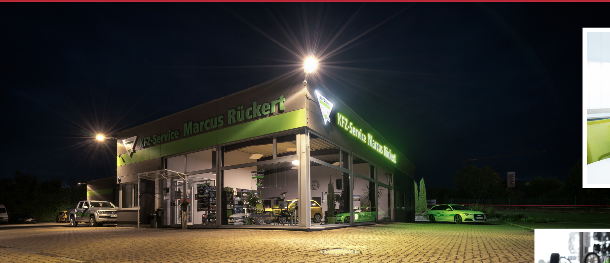
Die moderne AUTOteam plus-Werkstatt in Mellrichstadt erfüllt alle Ansprüche eines zukunftsorientierten Kfz-Betriebs.

RÜCKERT: Wohl der Kunden geht vor Profit